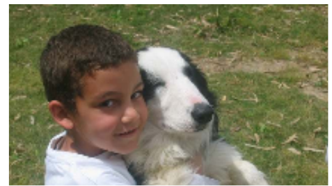
Honden Trainings Project.

“Vrees niet Israel, want IK ben met u; zie niet angstig rond, want IK ben uw God. IK sterk u, ook help IK u, ook ondersteun IK u met Mijn heilrijke rechterhand.” Uit Jesaja 41:8-14